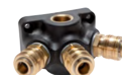
mit 3 Kupplungsdosen

Alle Angaben verstehen sich als unverbindliche Richtwerte! Für nicht schriftlich bestätigte Datenauswahl übernehmen wir keine Haftung. Druckangaben beziehen sich, soweit nicht anders angegeben, auf Flüssigkeiten der Gruppe II bei +20°C.