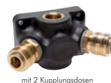
mit 2 Kupplungsdosen