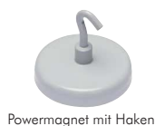
Powermagnet mit Haken