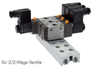
für 3/2-Wege Ventile

Lieferumfang: Grundkörper mit Schrauben und Dichtungen (Ventile bitte separat bestellen)