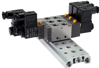
für 5/2-Wege & 5/3-Wege Ventile